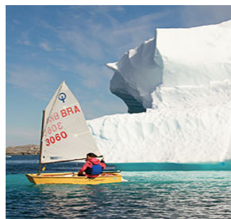
Na viagem, elas velejaram com um Optimist (pequeno veleiro, próprio para crianças)